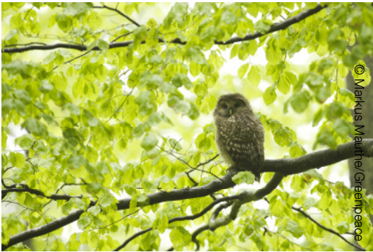
Käuzchen im Bayrischen Wald