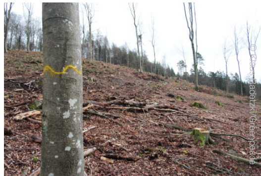
Kahlschlag im Spessart

vergeben wird. Als Folge davon sind in den Staatswäldern fast aller Regionen Mängel festzustellen: Dies reicht von Kahlschlägen über zu starke Holzeinschläge in alten Laubwäldern und massive Bodenschäden durch die hoch mechanisierte Holzernte bis hin zum Einschlag von Biotopbäumen. Der Holzeinschlag wird in der Regel ganzjährig durchgeführt, ohne Rücksicht auf Brut- und Aufzuchszeiten. Harvester-Einsätze und Holzabfuhr erfolgen rund um die Uhr, also auch nachts.“ 14